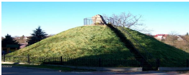
Zdjęcie Nr 14: Kopiec Pyrza w Nowosielcach