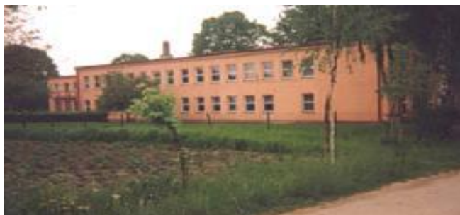
Zdjęcie Nr 8: Zespół Szkół w Studzianie

W 2002 roku nadano Szkole imienia Św. Brata Alberta. W roku 1999 wprowadzono reformę oświatową - Szkołę podstawową ograniczono do 6. klas. Po ukończeniu klasy VI uczniowie kontynuowali naukę w 3-letnim gimnazjum. Od 2003 roku szkoła funkcjonuje jako Zespół Szkół. Zespół Szkół w Studzianie posiada Krajowy Certyfikat Szkoły Promującej Zdrowie.