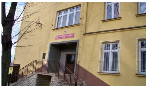
Zdjęcie Nr 5: Zespół Szkół w Grzęsce