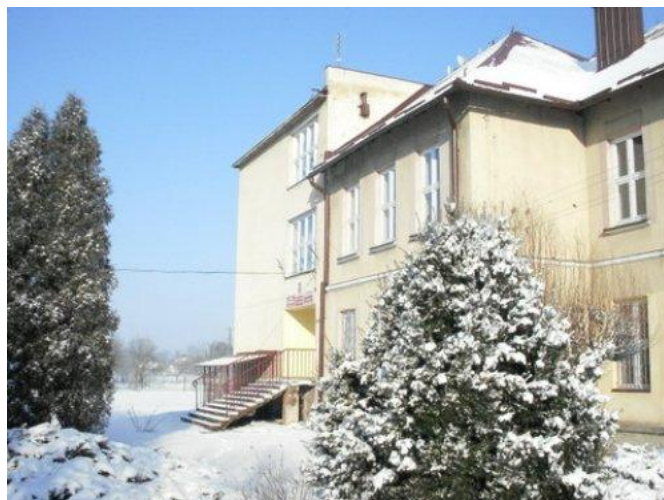
Zdjęcie Nr 9: Zespół Szkół w Świętoniowej