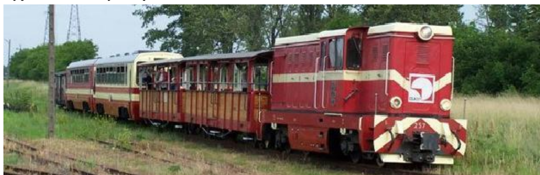
Zdjęcie Nr 15: kolejka wąskotorowa