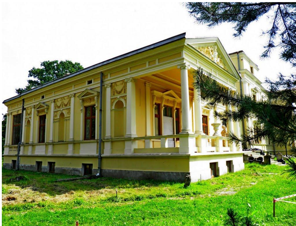
Zdjęcie Nr 3: Zespół Pałacowo-Parkowy w Urzejowicach

Podsumowując tą część opracowania należy stwierdzić, iż dziedzictwo kulturowe zachowane na terenie gminy Przeworsk ma spore znaczenie dla rozwoju turystyki i będzie miało istotne znaczenie przy określaniu kierunków rozwoju gminy w najbliższej przyszłości.