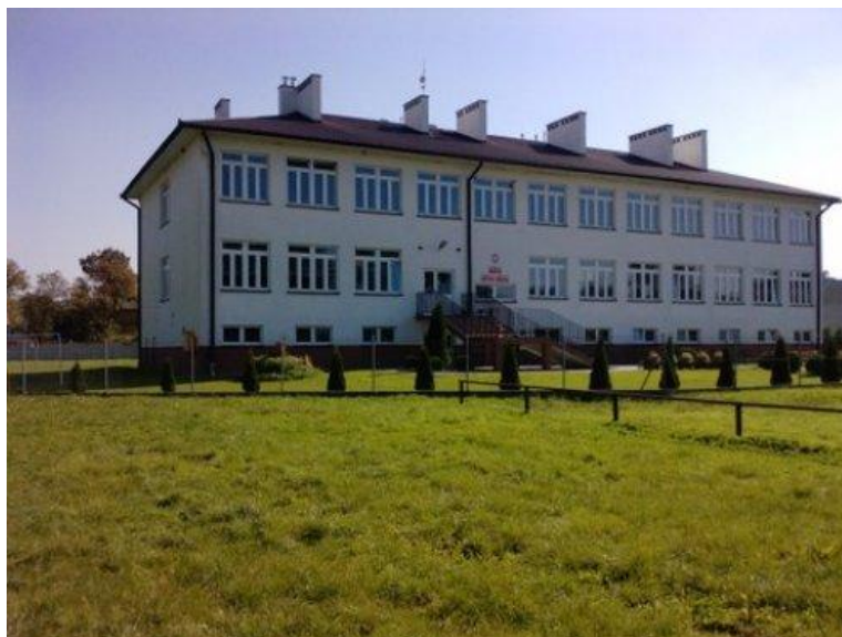
Zdjęcie Nr 10: Zespół Szkół w Ujeznej