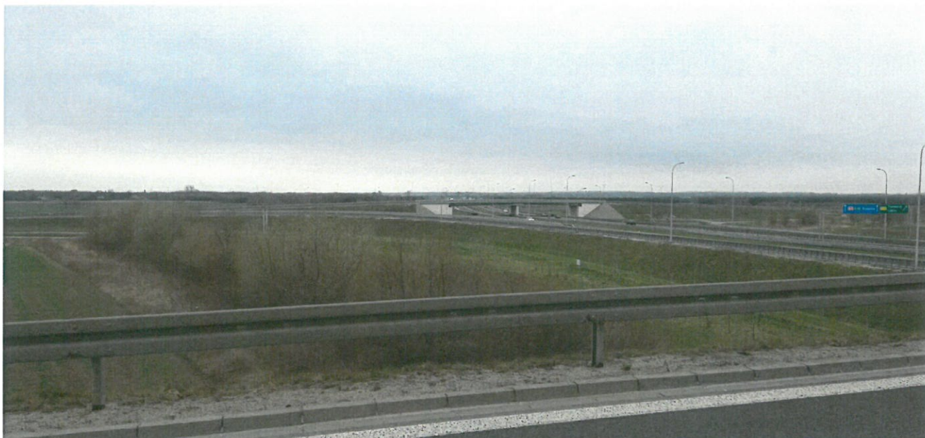
Widok na połączenie komunikacyjne z A-4