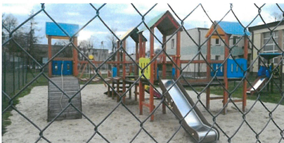
Plac zabaw przy Szkole Podstawowej