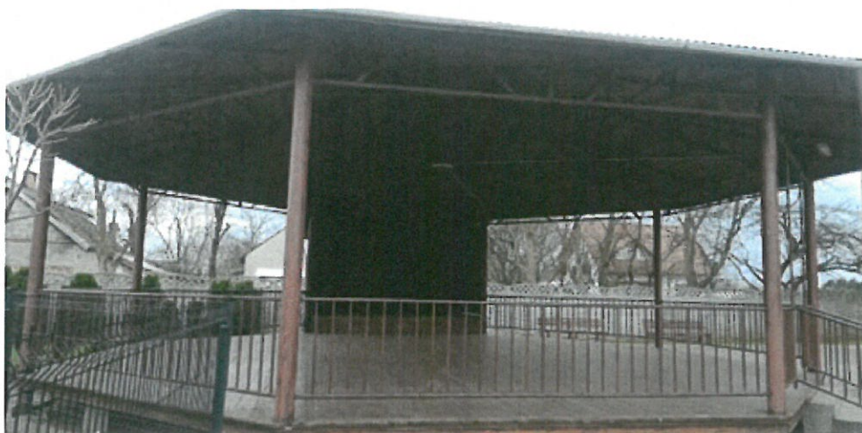
Grzybek przy WDK w Gorliczynie