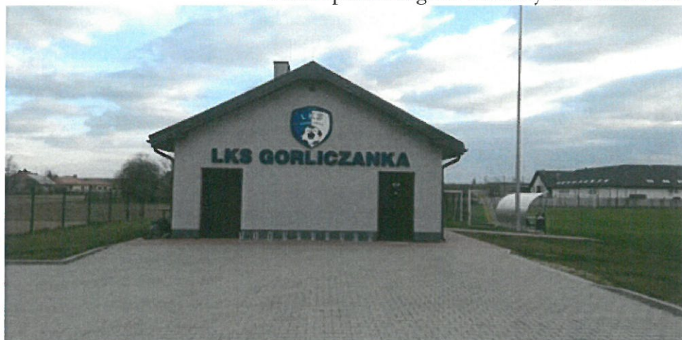
Budynek LKS Gorliczanka