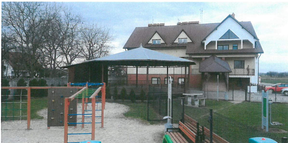
Widok na WDK w Gorliczynie oraz plac zabaw oraz Grzybek