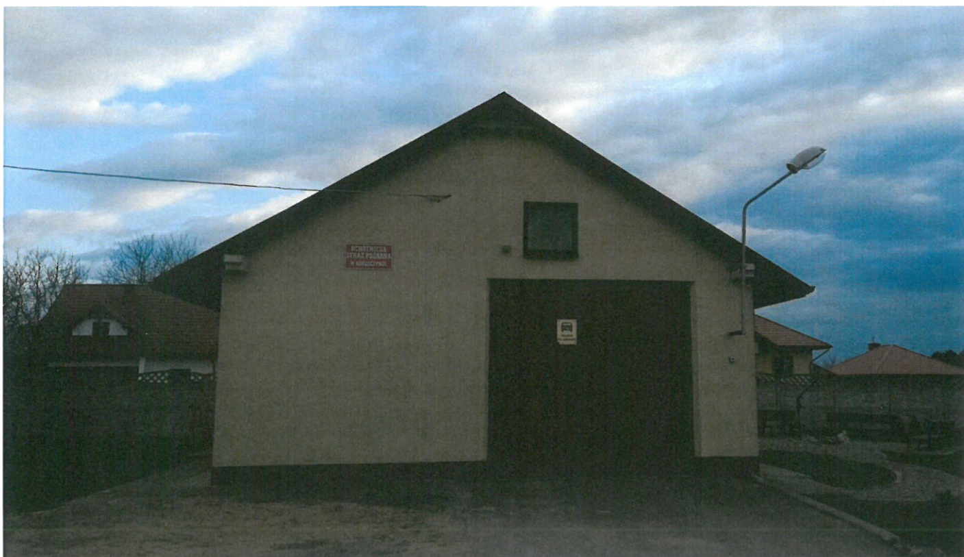
Budynek OSP w Gorliczynie