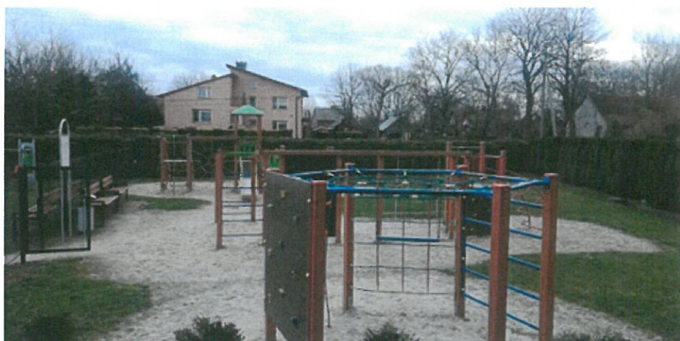
Plac zabaw przy WDK w Gorliczynie