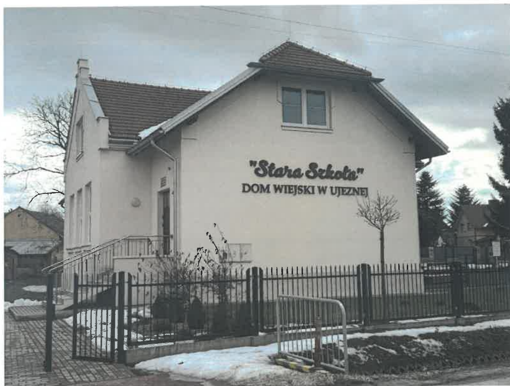
Budynek Wiejski w Ujeznej