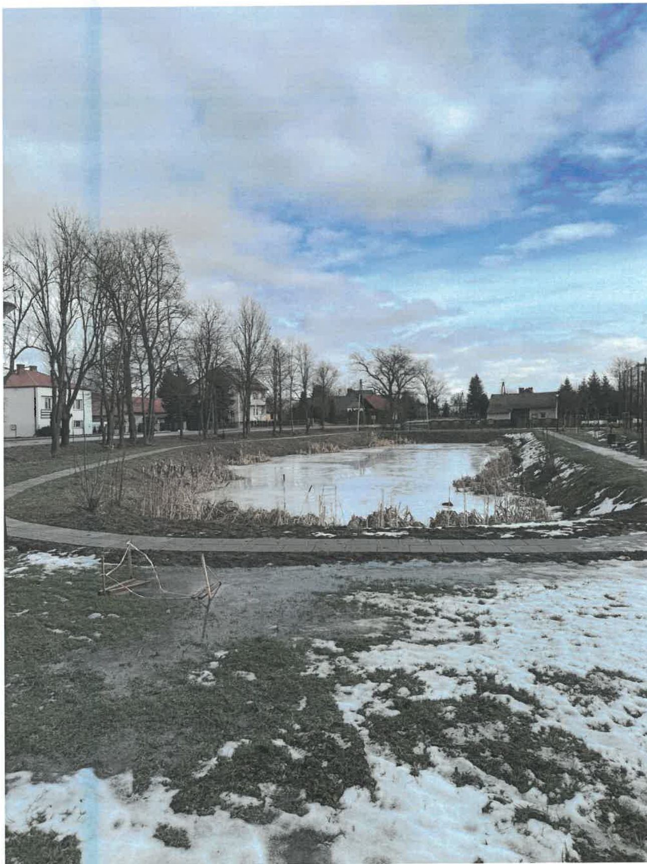
Miejsce wypoczynku przy stawie w Ujeznej