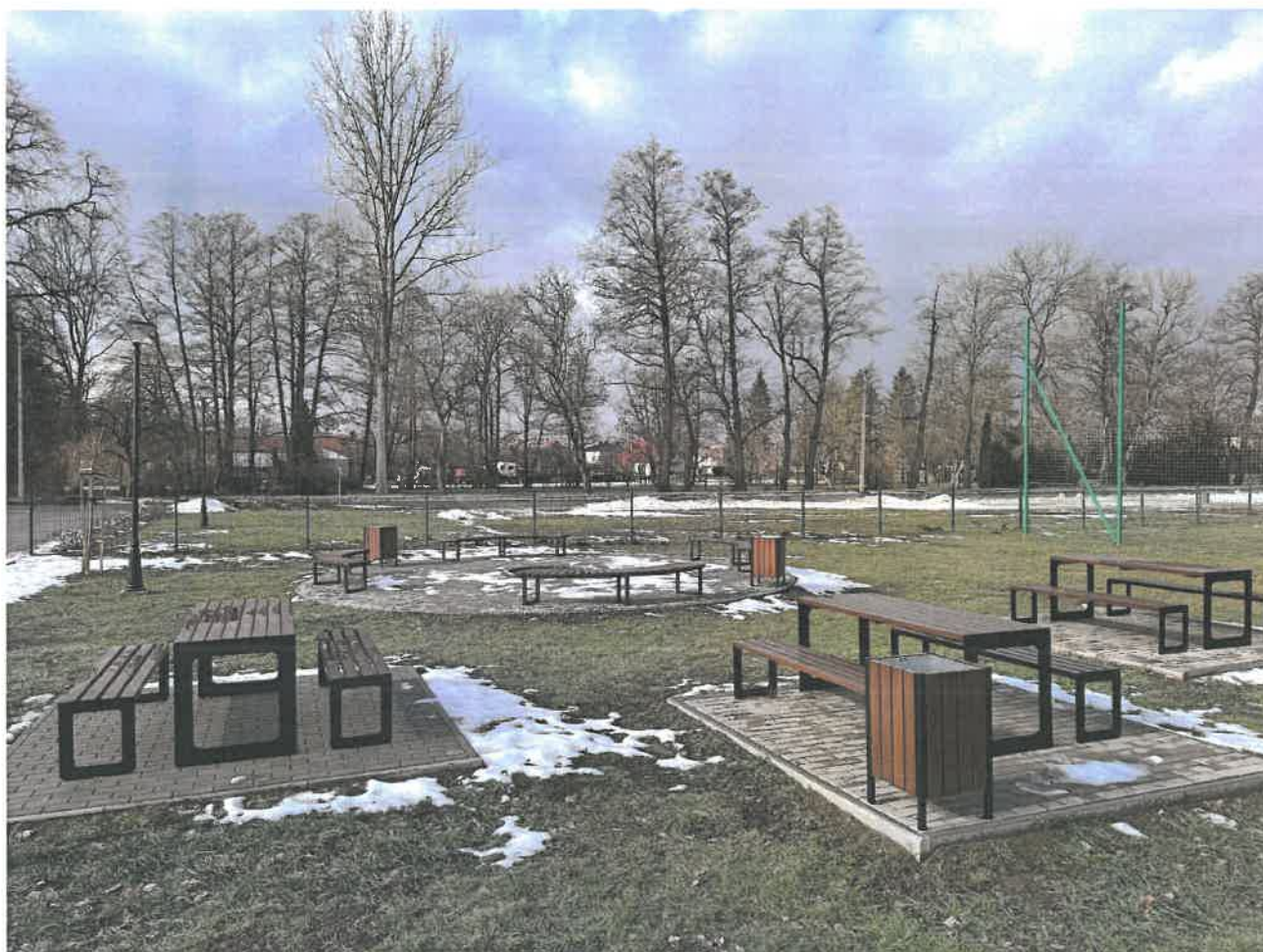
Miejsce do wypoczynku