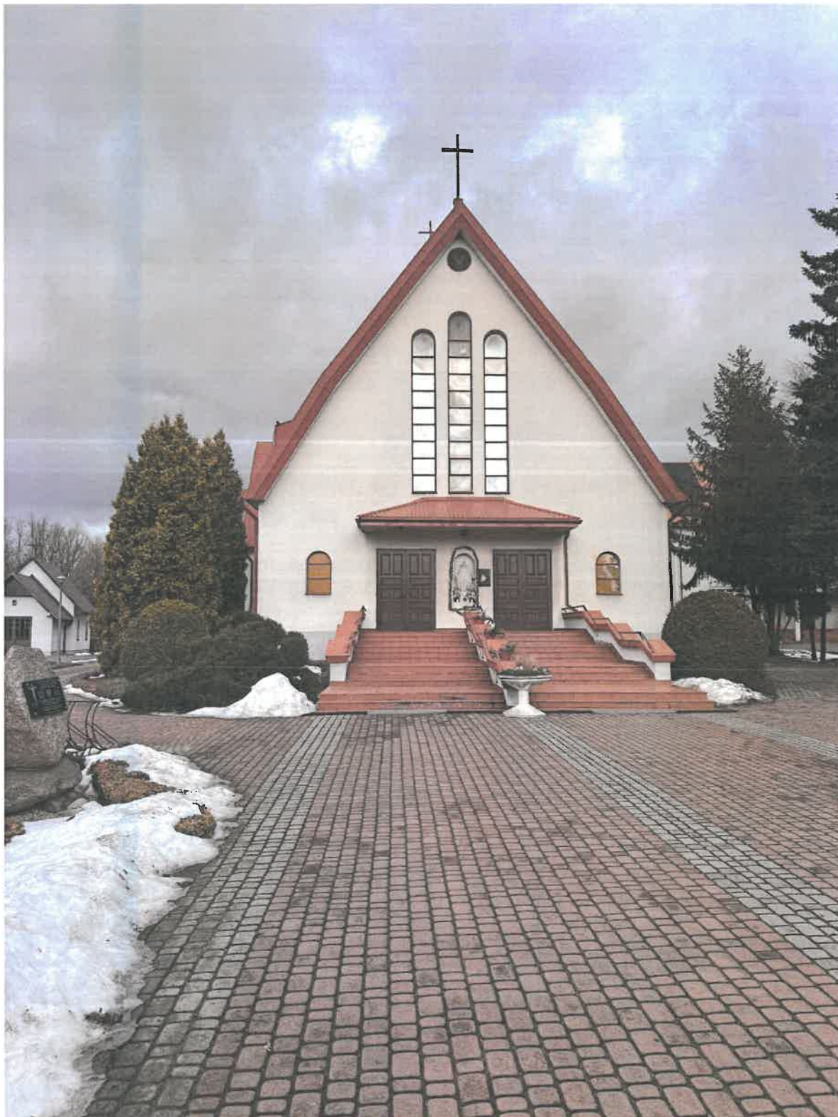
Kościół p.w. Matki Bożej Pocieszenia w Ujeznej