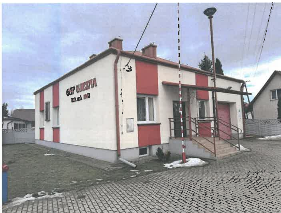
Budynek OSP w Ujeznej