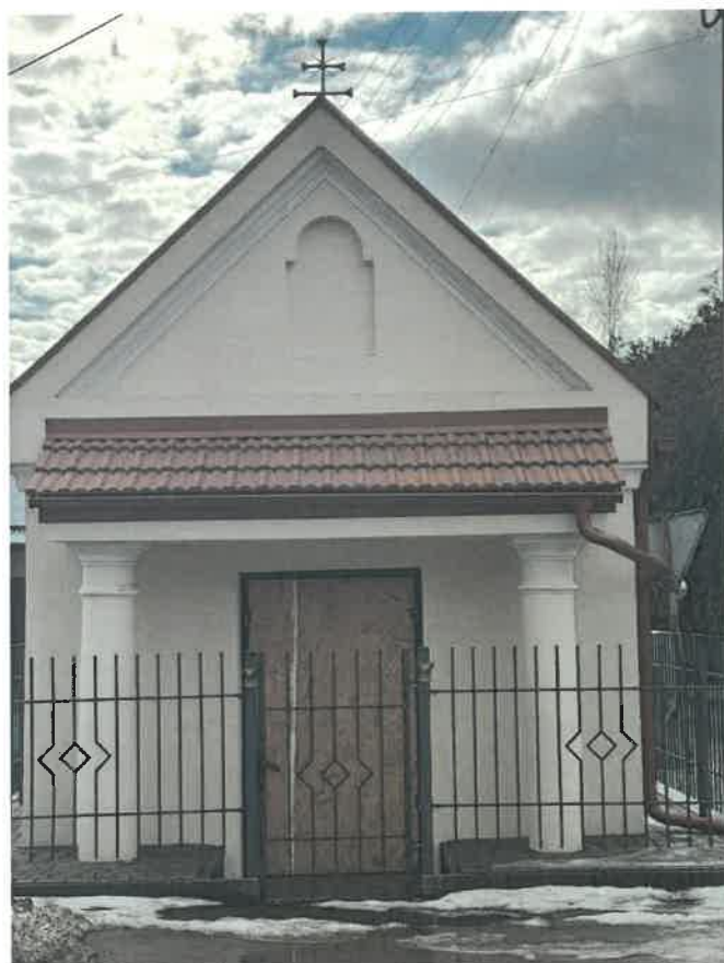
Kaplica Bożogrobców w Ujeznej ( kaplica w trakcie remontu )