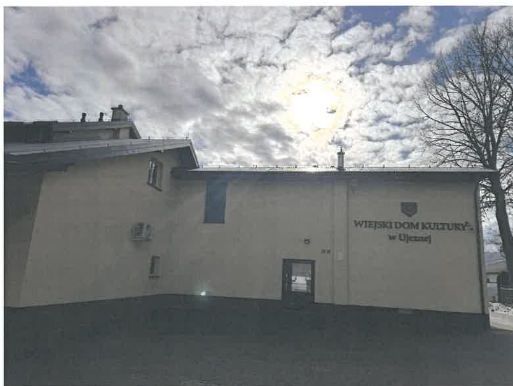
WDK w Ujeznej